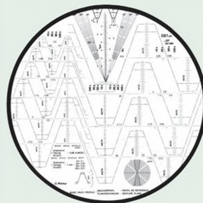
Эвольвентные зубья шестерни